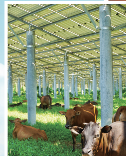
光伏板下好乘凉 新能源公司 林艺