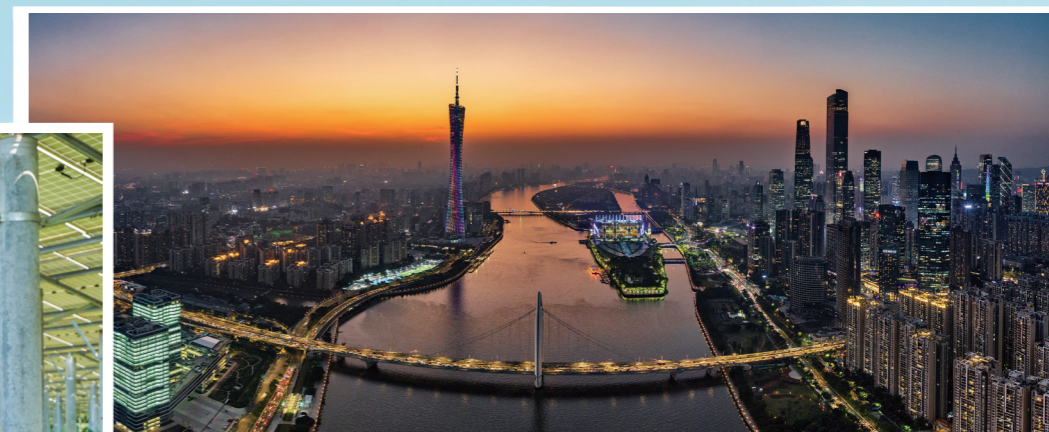
万家灯火 燃气南区分公司 杜健华