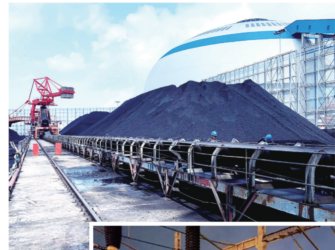
春节期间燃煤供应现场